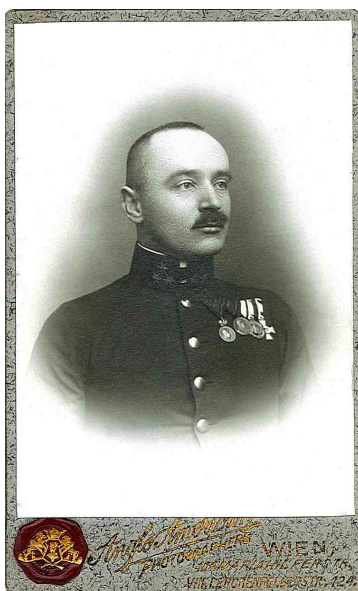
Fig. 2. Fotografie a căpitanului Artur Dan, Viena, 1912.

Așadar, Artur Dan a văzut lumina zilei la 8 ianuarie 1879 în localitatea Bocicoel din Maramureș, unde tatăl său, Basiliu Dan, era preot greco-catolic. Asemenea fraților săi, a făcut studii liceale la Iglo (Nowa Wies Spiska – Slovacia) și a fost admis, în anul 1893, la Școala militară de cadeți din Budapesta. În anul 1897, la absolvirea școlii, obține gradul de stegar și este repartizat la Regimentul nr. 37 infanterie „Erzherzog Joseph”, fiind apoi mutat cu trupa în diferite garnizoane militare – Timișoara, Oradea, Mostar, Viena și Zagreb, unde se afla în iulie 1914, la izbucnirea războiului. Datorită calităților sale și capacității de bun organizator a fost decorat de mai multe ori și apoi avansat la gradul de căpitan în 1 noiembrie 1912, fiind numit între timp și adjunct al regimentului.