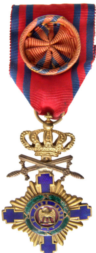
Fig. 6. Ordinul Steaua României în grad de Ofițer, (1925).