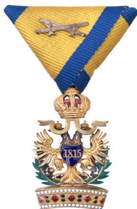
Fig. 3. Ordinul Coroana de Fier cu însemne de război.