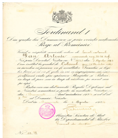
Fig. 5. Brevet de înălțare la gradul de colonel semnat de regele Ferdinand, 1924.

să-i acorde gradul de colonel prin Decretul regal nr. 1657/7.04.1923 (Fig. 5). În toată această perioadă i-au fost conferite o serie de decorații militare, printre care și Ordinul Steaua României în grad de Ofițer (Fig. 6). Spre sfârșitul carierei sale militare a fost numit comandant al Regimentului 81 Dej (1929) 29 , iar apoi șef al Centrului de recrutare din Cluj, de unde s-a pensionat în anul 1935 cu gradul de general în rezervă.